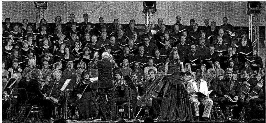
Das fabelhaft aufgeführte „Carmina Burana“ lud zum Träumen und Schwärmen ein. Der rund 150 Stimmen starke Chor hinterließ unter der Gesamtleitung von Gerd Guglhör einen imposanten Eindruck.

Der sagenhafte Abend mit den mehr als 700 Gästen begann mit Igor Strawinskys „Psalmensymphonie“. Die zugrunde liegenden Texte sind drei Psalmen (38, 40 und 150) aus dem Alten Testament. Dem Ruf nach Hilfe im ersten Satz folgte die Zuversicht, diese zu erhalten im zweiten Satz und endlich die Lobpreisung Gottes im dritten Satz. Nach dem kurzen ersten war der zweite Satz in Form einer beeindruckenden Doppelfuge komponiert, in der die Orchesterinstrumente das erste und die Chorstimmen das zweite Thema aufgriffen. Der dritte Satz ließ den Text in vielschichtigen Ausdrucks-